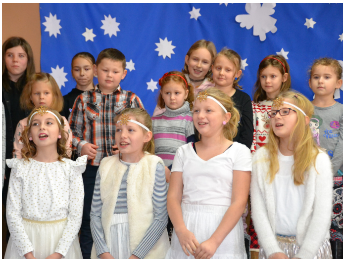
Vánoční besídka, foto: Marcela Formánková