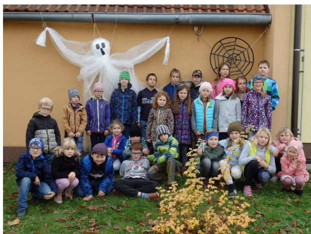
Halloween ZŠ

Mgr. Marcela Formánková, ředitelka ZŠ a MŠ