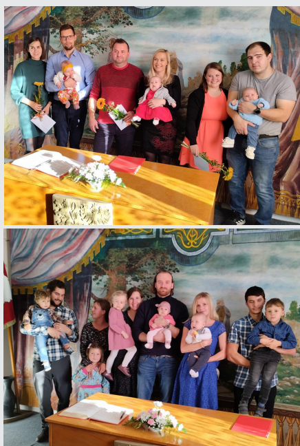
Vitání občanků podzim 2022, foto: Josef Klaus