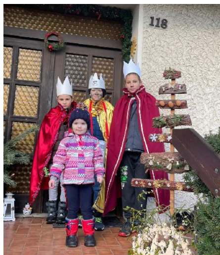
Tříkrálová sbírka

celkem za všechny obce 32.331,-Kč. Děkuji všem, kdo přispěli potřebným a na charitu, a též všem, kdo se na organizaci sbírky podíleli.