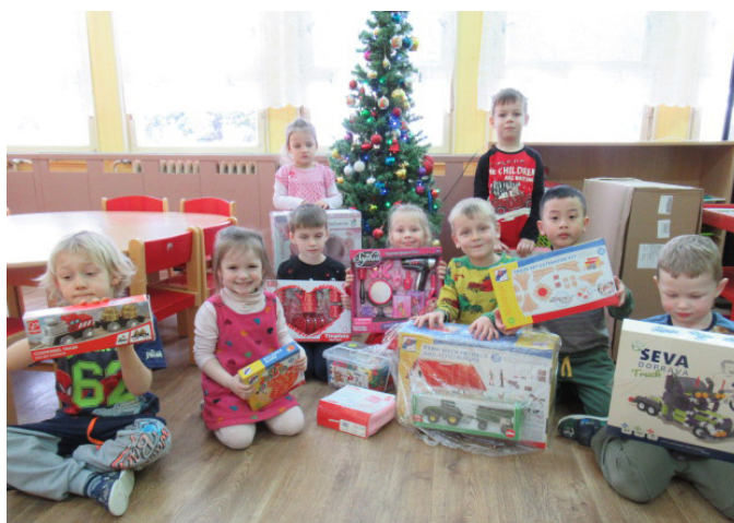
Vánoční nadílka MŠ, foto: Olga Jonášová, Lucie Bernatová

Olga Jonášová, Lucie Bernatová, učitelky MŠ