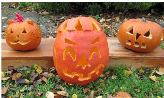
Halloweenská tvorba MŠ