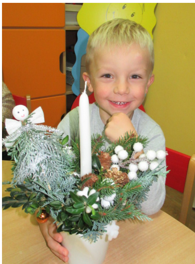
Dílnička MŠ