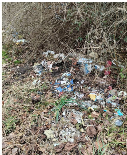
Toto doopravdy do biokoridoru nepatří, foto: Josef Klaus