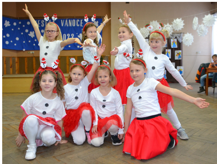
Vánoční besídka, foto: Marcela Formánková