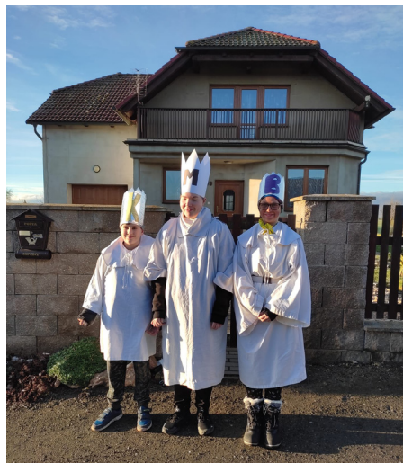
Tříkrálová sbírka

Tříkrálová sbírka má v našich obcích už dlouholetou tradici. V letošním roce 2023 bylo vybráno ve Vlkanči 18.751,- Kč, v Kozohlodech 7.580,- Kč a v Příbyslavicích 6.000,- Kč,