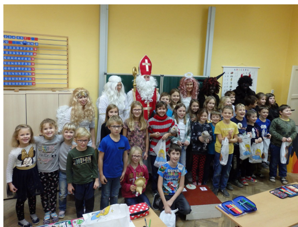
Mikuláš ZŠ, foto: Marcela Formánková