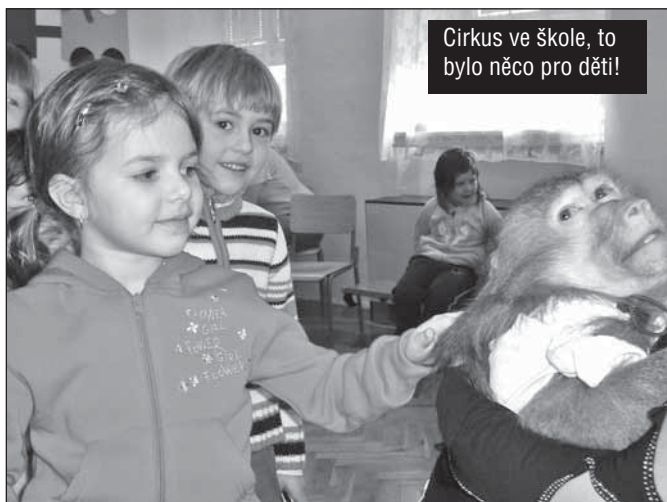
Cirkus ve škole, to bylo něco pro děti!

V měsíci březnu do MŠ přijelo se svým představením divadélko z Kladna. Spolu s nimi se