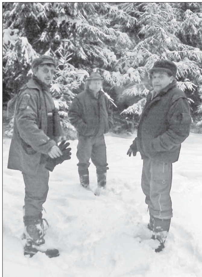
Zima byla letos opravdu vytrvalá

V měsíci červnu budeme pořádat už tradiční dětský den s myslivci. Přesný termín bude zveřejněn na plakátech.