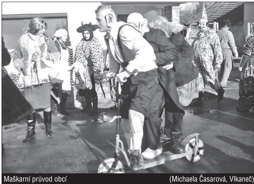
Maškarní průvod obcí