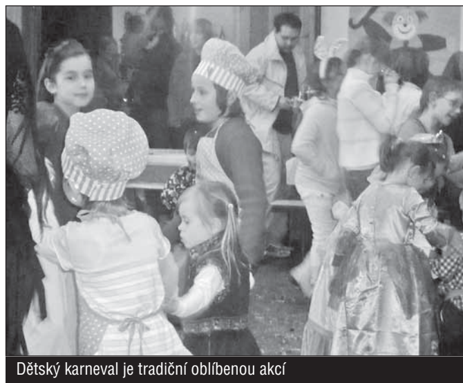
Dětský karneval je tradiční oblíbenou akcí

Proběhl 1.3.2009 za velké účasti dětí i dospělých. Celým odpolednem nás prováděly a bavily čarodějky „Saxany“. Pro děti byla připravena bohatá tombola. Dík patří všem sponzorům.