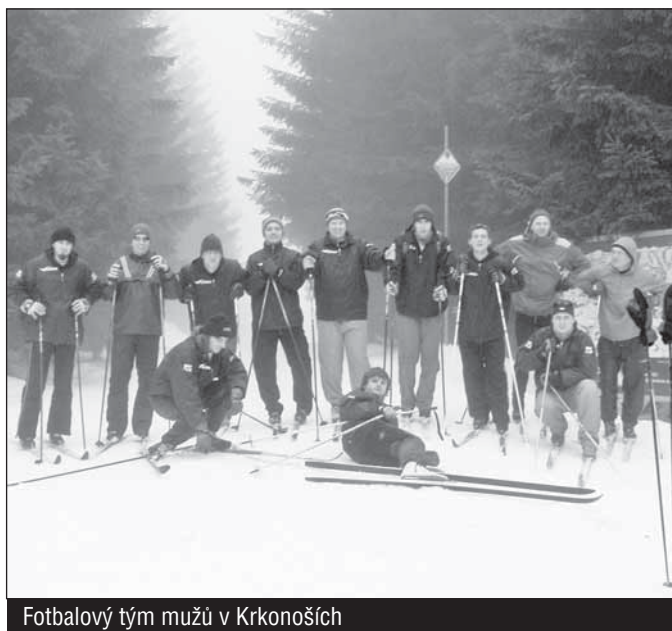
Fotbalový tým mužů v Krkonoších