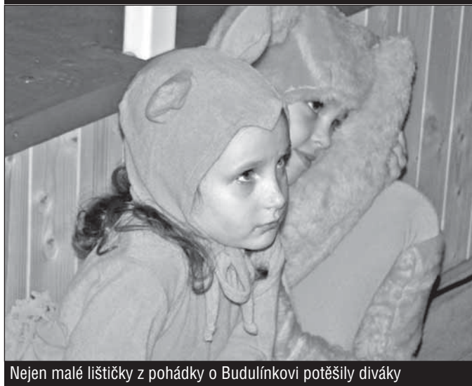
Nejen malé lištičky z pohádky o Budulínkovi potěšily diváky