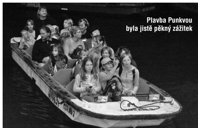
Plavba Punkvou byla jistě pěkný zážitek