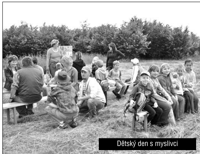
Dětský den s myslivci

Dne 20.6.2009 uspořádalo naše sdružení už poněkoliště dětský den. Účast dětí byla podobná jako v předešlých letech. Letos proběhl na jiném místě honitby, kde byly pro děti připraveny různé úkoly, kterých se zhostily velmi dobře. Zprávkou byla dle jejich ohlasu jízda v terénním automobilu. Počasí se vydařilo, takže tradiční opékání vuřtů po splnění všech disciplín se také mohlo uskutečnit. Tímto všechny zveme a těšíme na setkání v příštím roce.