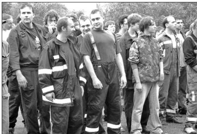
Hasičské družstvo dorostenců Vlkaneč