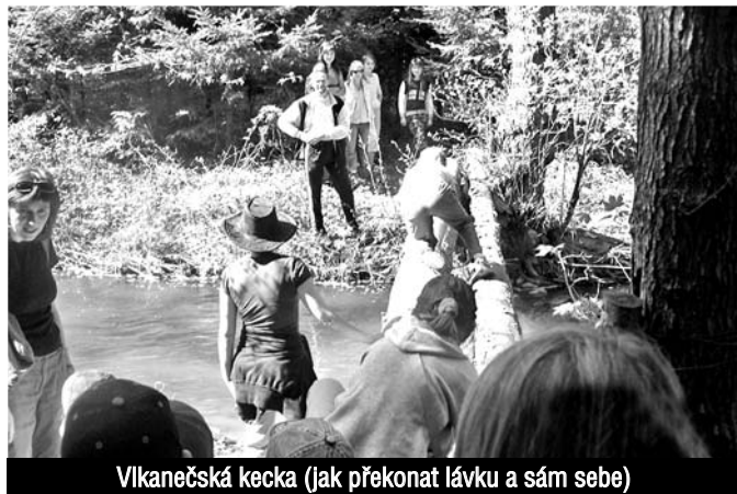
Vlkanečská kecka (jak překonat lávku a sám sebe)

Během prázdnin proběhne střelecká soutěž. Termín upřesníme na plakátech.