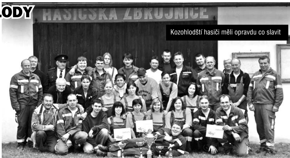
Kozohlodští hasiči měli opravdu co slavit

4.července se konalo posezení u Návesního rybníka. Tato tradiční akce se v minulých letech konala u Polního rybníka. Letos podruhé byla místem konání náves. Dů-