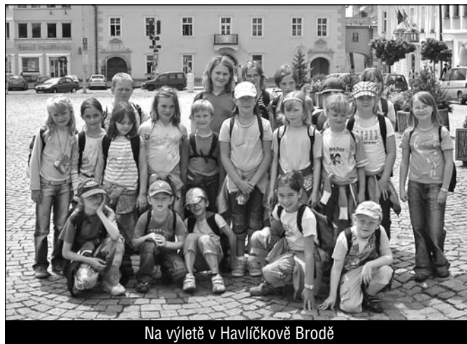
Na výletě v Havlíčkově Brodě

předškoláků v MŠ, spojené s výletem do Ledče nad Sázavou. Děti dokázaly, že umí být samy bez maminky a všem se „spaní“ líbilo.