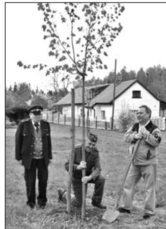
Hasiči se stali patrony nově nasázených lip v obci