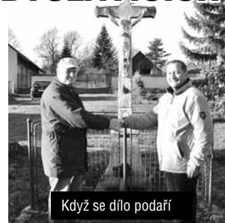
Když se dílo podaří