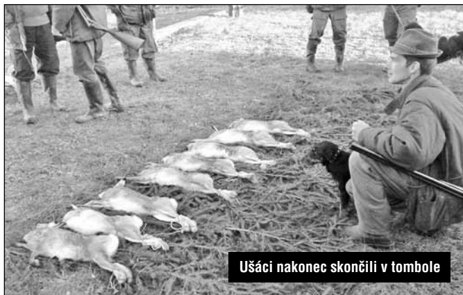
Ušáci nakonec skončili v tombole

V listopadu se uskutečnila Hubertská zábava a na začátku roku tradiční myslivecký ples. Tomboly byly bohaté. Děkujeme všem za účast a těšíme se další setkání na mysliveckém plese, který se bude konat dne 7.1.2011.