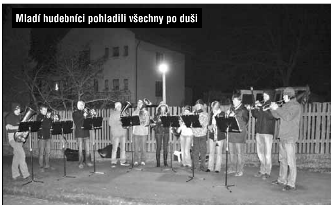
Mladí hudebníci pohládili všechny po duši

Během slavnostního rozsvícení stromečku byla podávána teplá medovina, koláče a pemíčky za zvuku vánočních koled. Na závěr zazněla známá vánoční píseň „Vánoce, Vánoce, přicházejí“ v