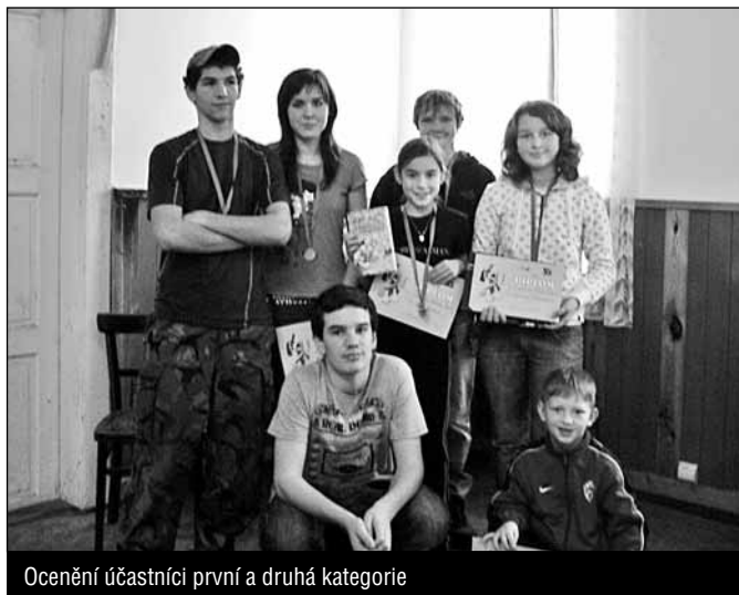
Ocenění účastníci první a druhá kategorie