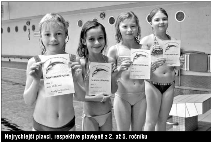
Nejrychlejší plavci, respektive plavkyně z 2. až 5. ročníku