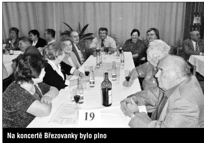
Na koncertě Březovanky bylo plno