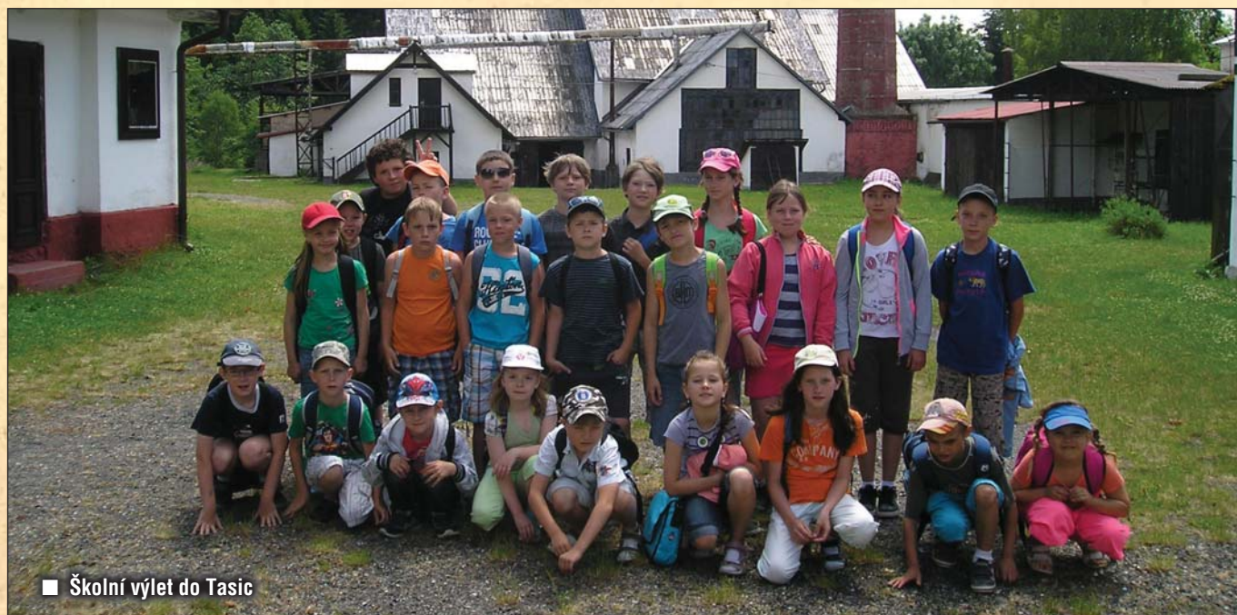
■ Školní výlet do Tasic