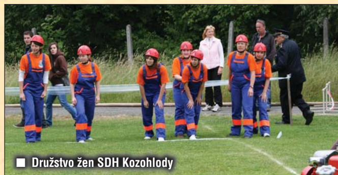
■ Družstvo žen SDH Kozohlody