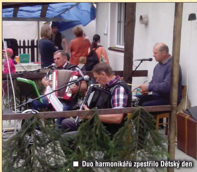
■ Duo harmonikářů zpestřilo Dětský den