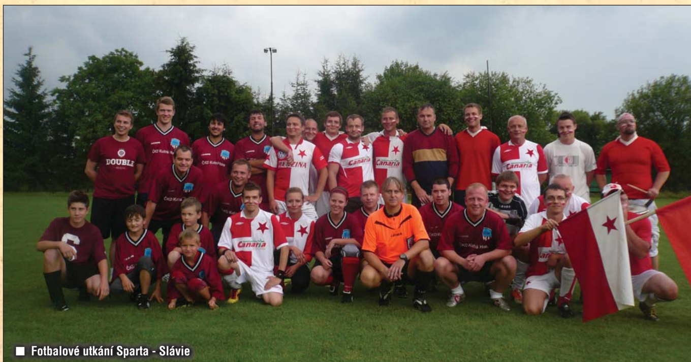
■ Fotbalové utkání Sparta - Slávie