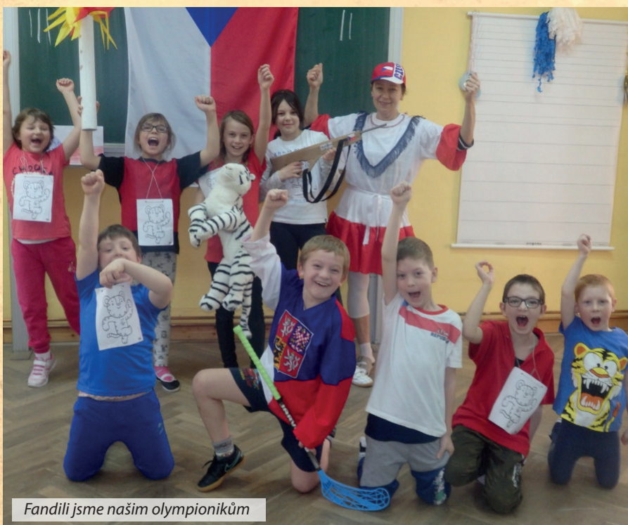
Fandili jsme našim olympionikům