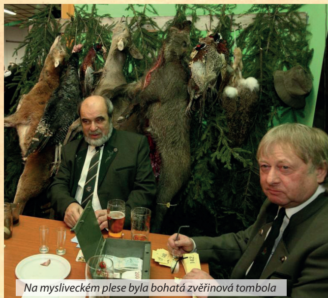
Na mysliveckém plese byla bohatá zvěřinová tombola