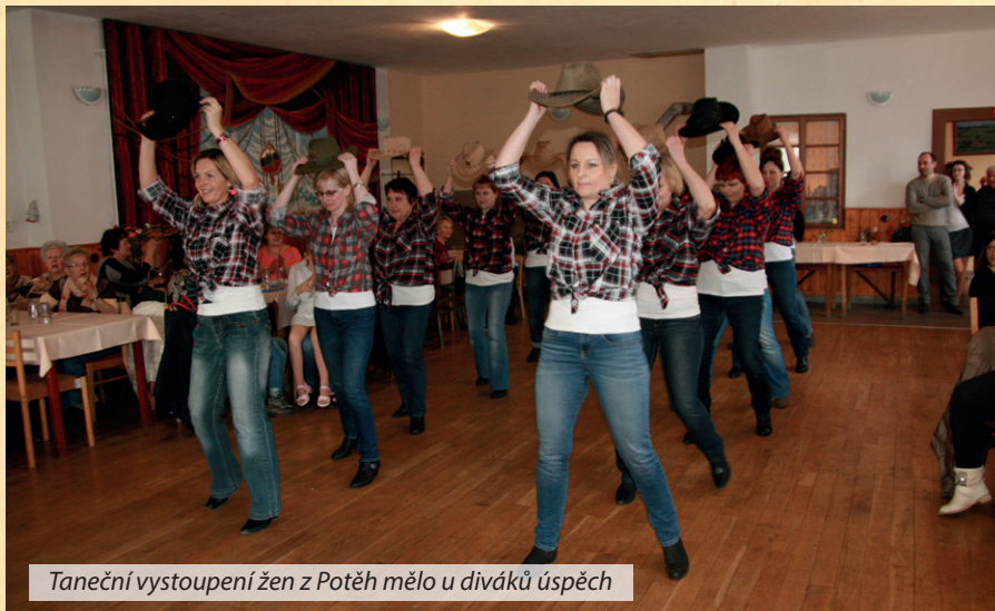
Taneční vystoupení žen z Potěh mělo u diváků úspěch

V sobotu 10. března 2018 jsme opět uspořádali, pro ženy naší obce, oslavu Mezinárodního dne žen. Každá žena byla na oslavu hasiči osobně pozvána a při příchodu do sálu dostala od členů místního sboru květinu. Starosta hasičů přivítal přítomné ženy, poděkoval jim za jejich práci a každodenní starost o rodinu a popřál jim k jejich svátku. Kozohlodské děti přednesly své básničky a spolek žen Potěhy předvedl velmi pěkné taneční vystoupení. Celé odpoledne pak patřilo hudebnímu orchestru Věnovanka, která skvěle hrála k poslechu i k tanci. Během jejich produkce bylo též podáno pohoštění.