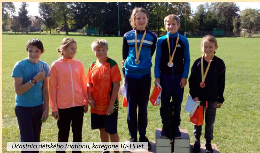
Účastníci dětského triatlonu, kategorie 10-15 let