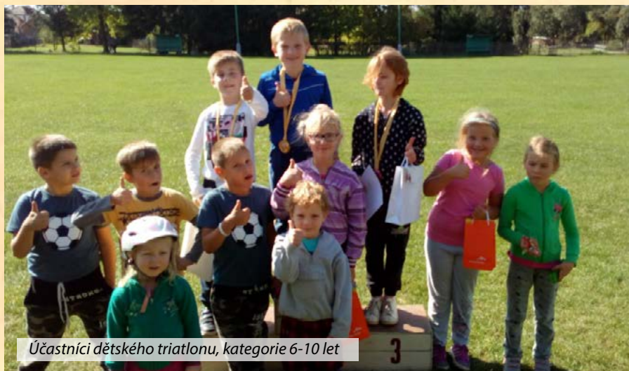
Účastníci dětského triatlonu, kategorie 6-10 let