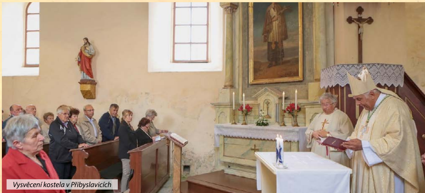
Vysvěcení kostela v Přibyslavicích