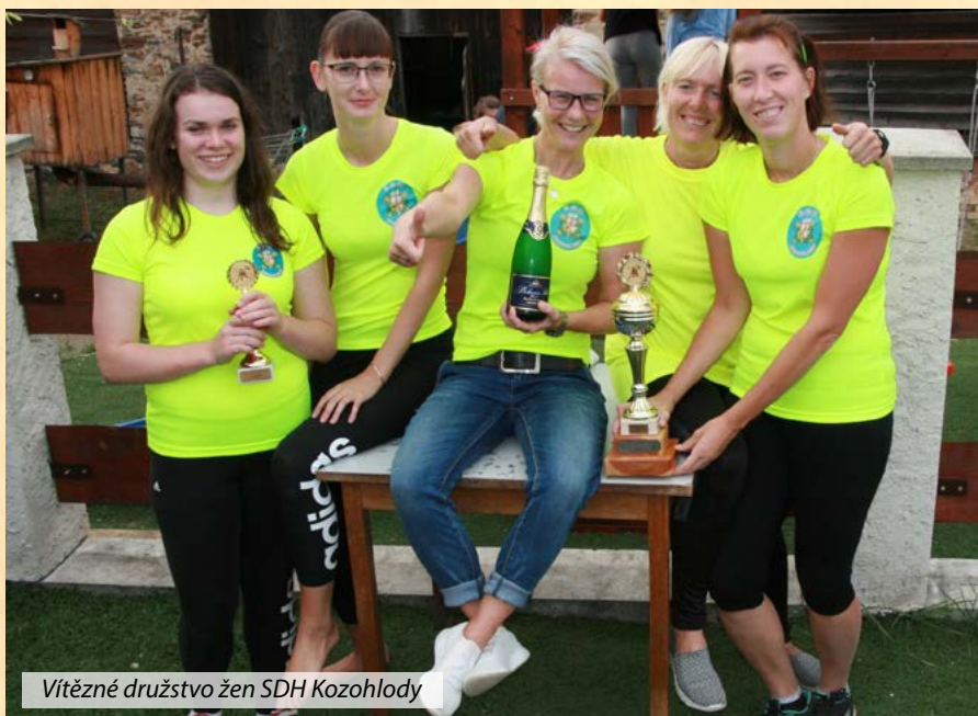
Vítězná družstva žen SDH Kozohlody