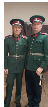
TJ Sokol Vlkaneč

Milí čtenáři, v minulém čísle Zpravodaje, jsem se zmiňovala, že předpokladem pro plánování dalších akcí, je zvolení výboru, což se podařilo, takže jsem tu zase s informacemi o činnosti našeho spolku. Tak teď sedím u počítače, s prsty nehybně položenými na klávesnici, a přemýšlím, co napsat, aby to bylo něčím zajímavé a jiné. Vždy po dopisání článku si řeknu, že už si musím dělat průběžně poznámky, ale když nastane čas pro další článek, tak zjistím, že sešit s názvem TJ je stále prázdný. Takže lovím v paměti a různých jiných zdrojích. Tentokrát mě z mého „trápení“ částečně vysvobodili členové a přátelé našeho spolku, kteří se aktivně účastnili sportovních akcí pořádaných jinými spolky či obcemi. Tentokrát tedy začnu těmito událostmi.