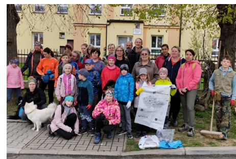
Uklidme Česko, Vlkanec