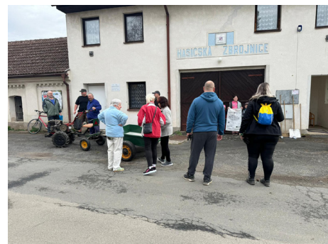
Uklidme Česko, Přibyslavice