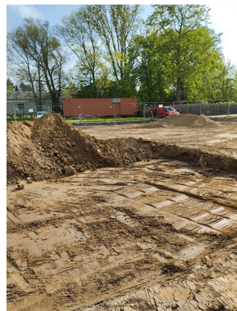
Výstavba sportovní haly ZŠ, Vlkanec