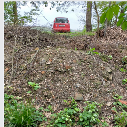
Černá skládka v Kozohloděch

Připomínáme, že svoz nebezpečného odpadu proběhne dne 9. července 2024 ( úterý) od 7.00 hodin ve všech třech našich obcích. Pokud dojde k nějakým změnám, budou Vám informace včas předány. Opět nemohu nepřipomenout, že občané našich obcí mají bezplatné uložení nebezpečného odpadu, kovů, objemných odpadu a stavební suti ve sběrném dvoře v Golčově Jeníkově a v případě uložení zeleného odpadu v kompostárně tamtéž.