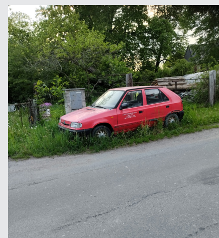
Nejsem celá nebezpečná, pomůže někdo?