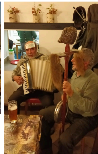
Posezení na poslední leči