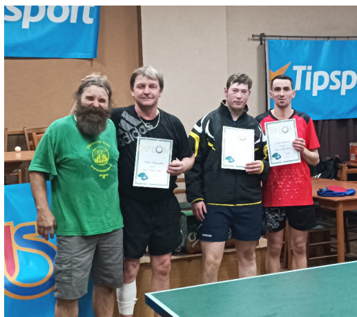
Turnaj ve stolním tenise v kategoriích dospělí a děti do 15 let