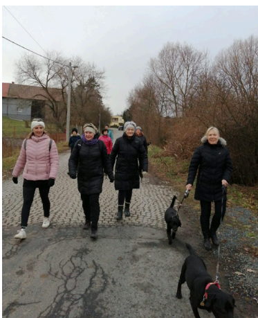
Procházka žen a dívek