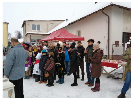
Vánoční jarmark a rozsvícení vánočního stromku ve Vlkanči