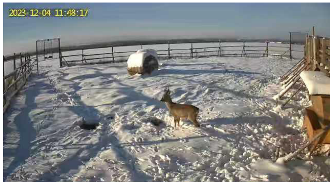
Odchytové zařízení v zimním období