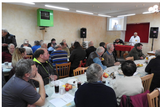
Stolní bodování Dobrovítov