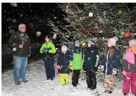
Slavnostní rozsvícení vánočního stromu