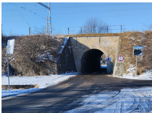
Nová zrcadla a dopravní značení