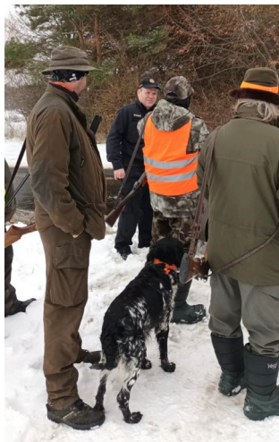
Kontrola Policií ČR při honě