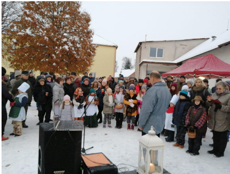
Pozehnutí svátků vánočních při rozsvícení vánočního stromku ve Vlkanči