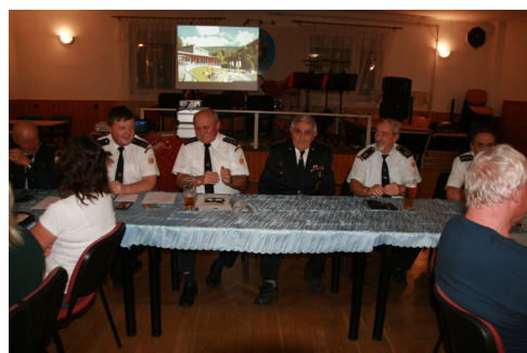
Valná hromada SDH Kozohlody