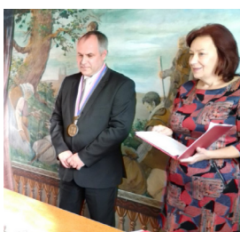
Vítání občánků