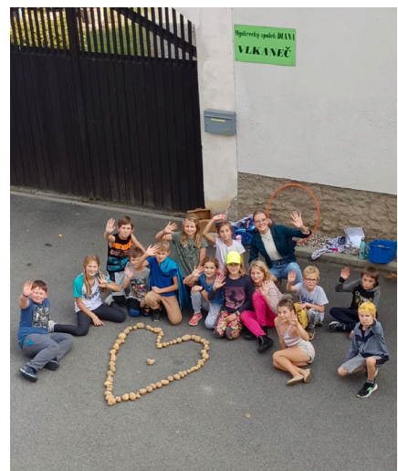
Posíláme srdce všem